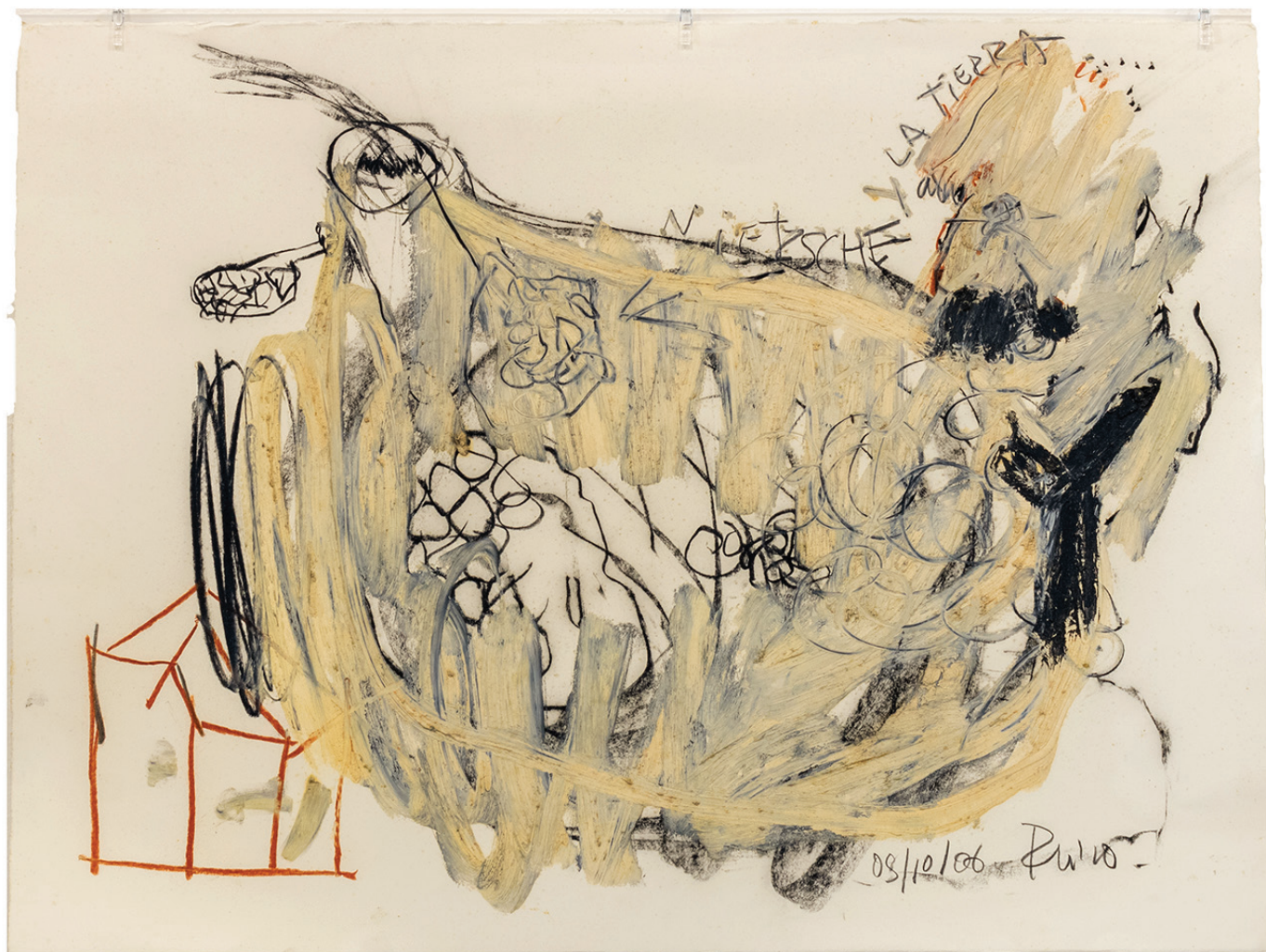
Galería de Papel. (In) Visibilibis. Octavio Russo (2024).