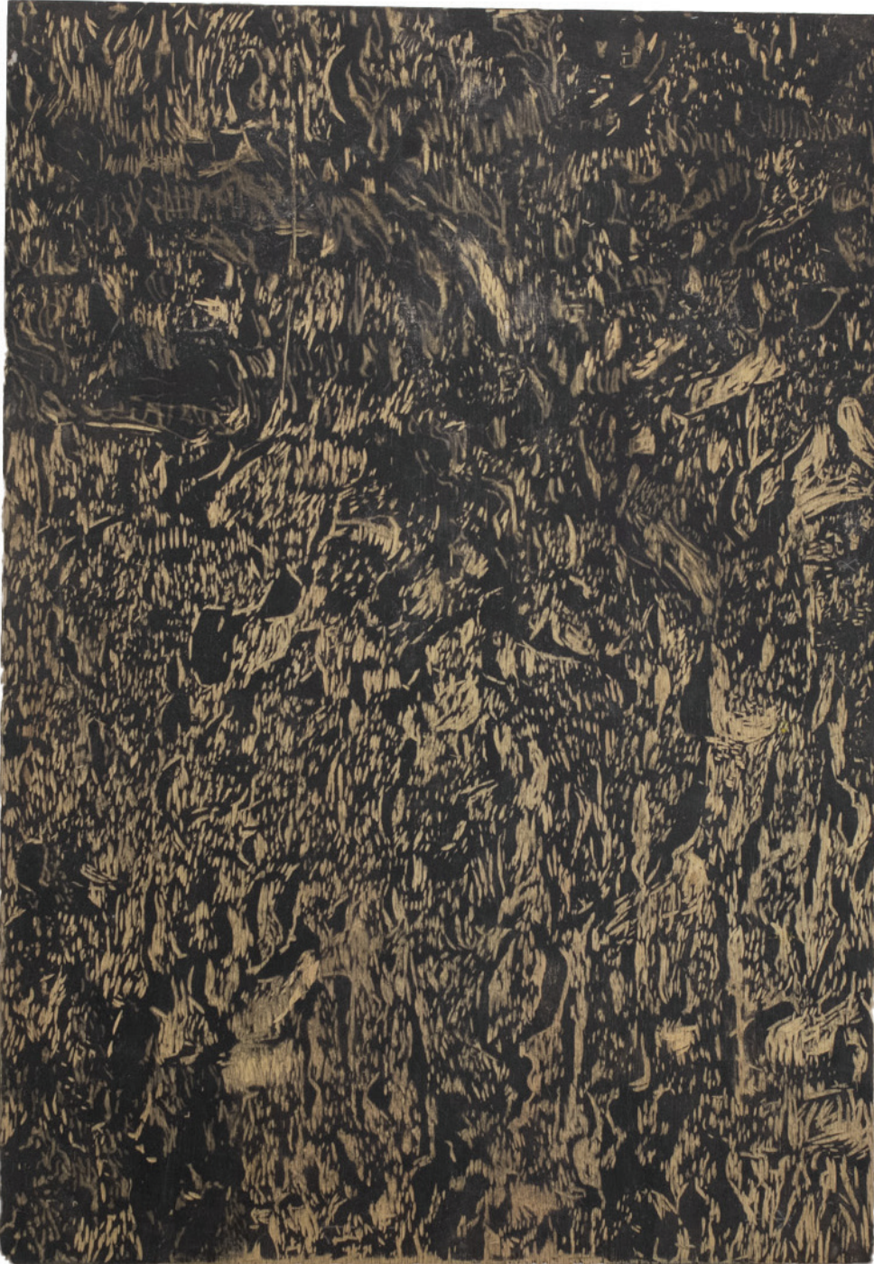
Galería de Papel. (In) Visibilis. Octavio Russo (2024).