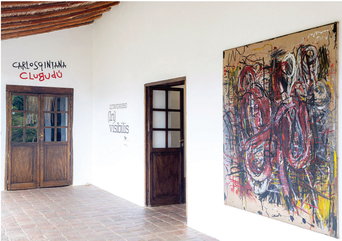
Galería de Papel. (In) Visibilis. Octavio Russo (2024).