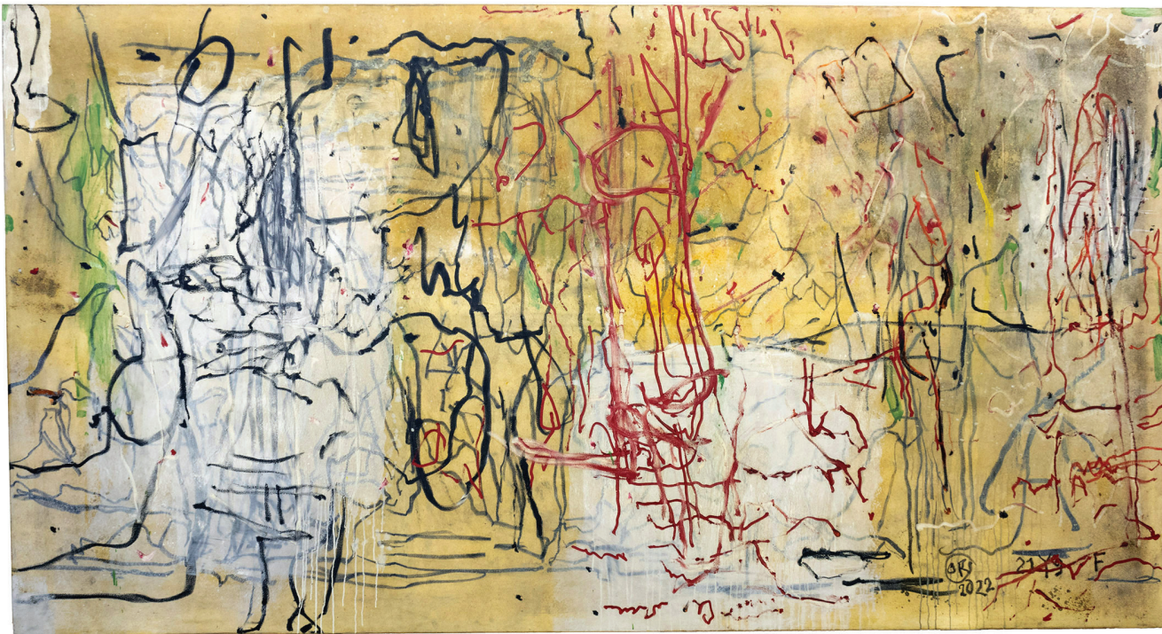
Galería de Papel. (m) Visibilis. Octavio Russo (2024).

de la espiritual: enmarañada en todos sus misterios y dimensiones.